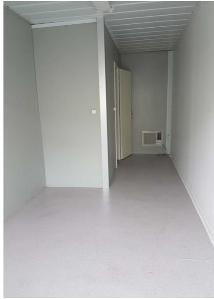
Certaines photos peuvent être non contractuelles