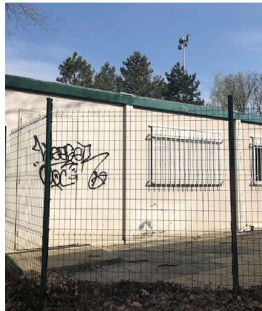
Certaines photos peuvent être non contractuelles