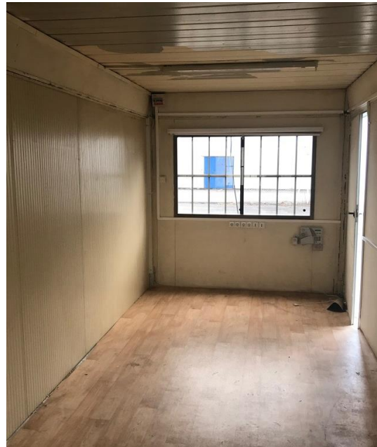
Certaines photos peuvent être non contractuelles