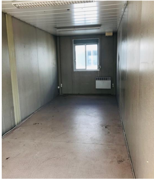
Certaines photos peuvent être non contractuelles