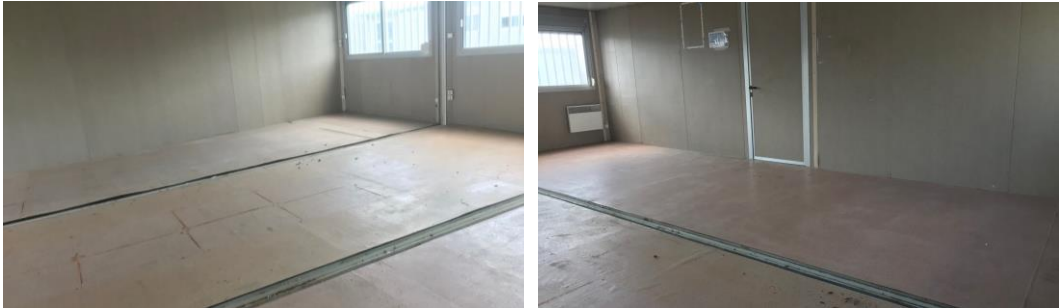
Certaines photos peuvent être non contractuelles