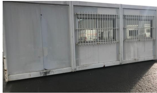
Certaines photos peuvent être non contractuelles