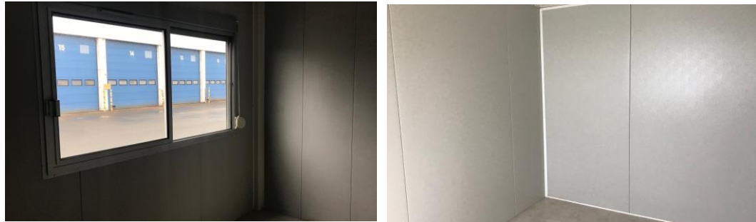
Certaines photos peuvent être non contractuelles