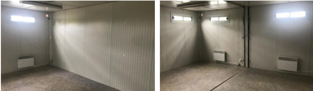
Certaines photos peuvent être non contractuelles