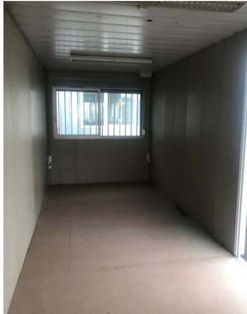
Certaines photos peuvent être non contractuelles