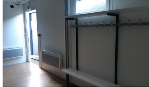
Certaines photos peuvent être non contractuelles