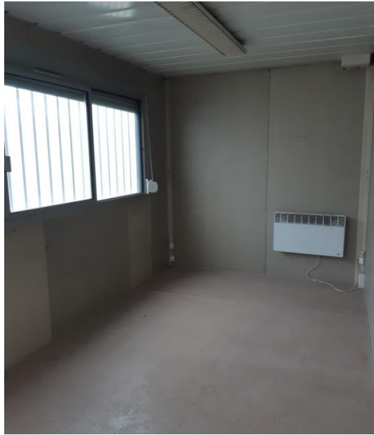
Certaines photos peuvent être non contractuelles