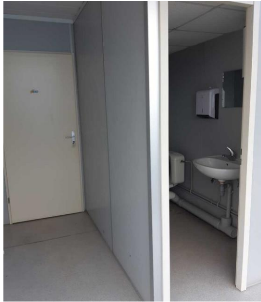
Certaines photos peuvent être non contractuelles