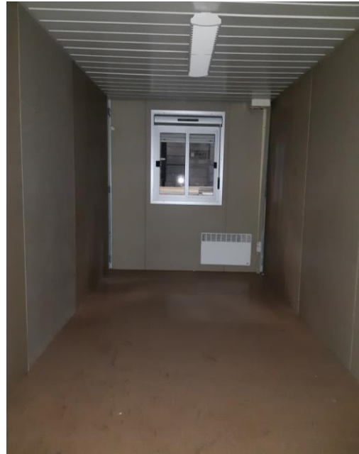
Certaines photos peuvent être non contractuelles