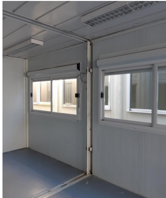
Certaines photos peuvent être non contractuelles