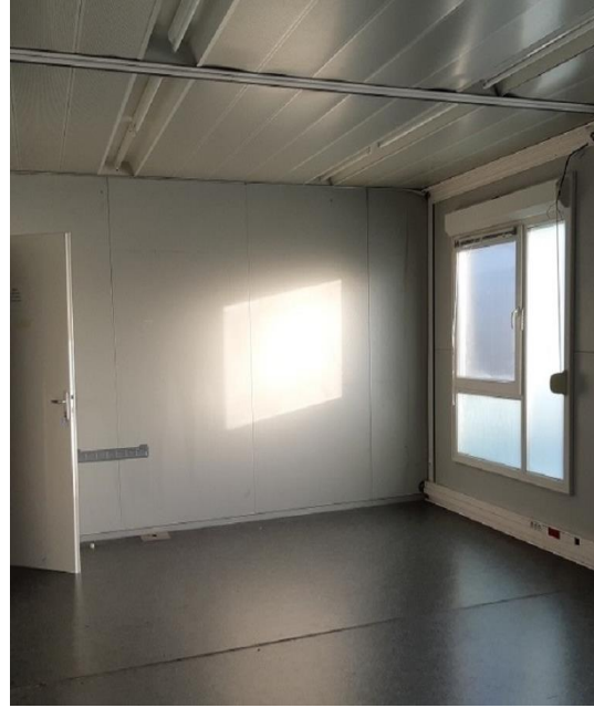
Certaines photos peuvent être non contractuelles