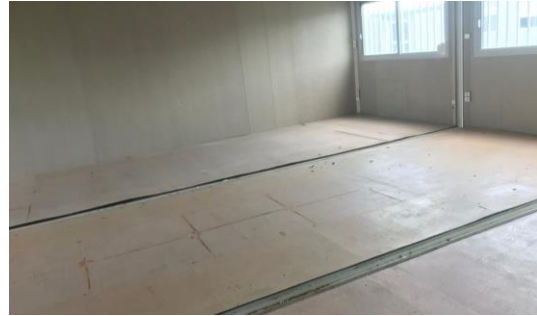
Certaines photos peuvent être non contractuelles