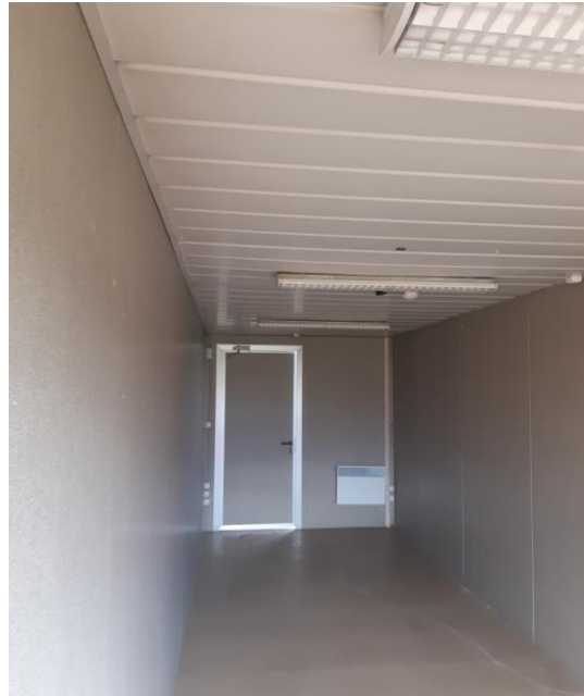
Certaines photos peuvent être non contractuelles