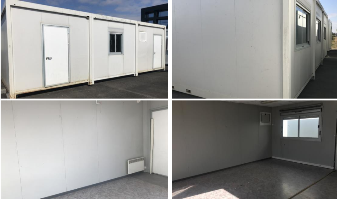
Certaines photos peuvent être non contractuelles