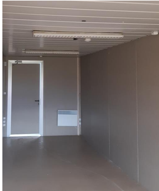
Certaines photos peuvent être non contractuelles