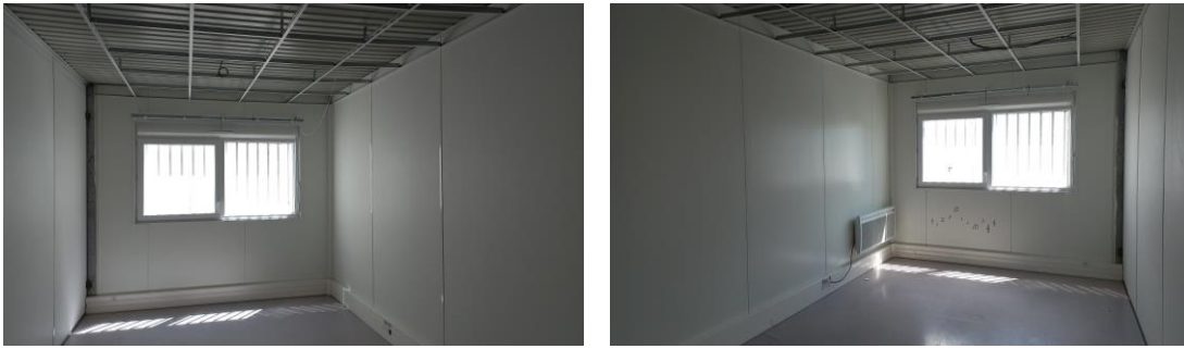
Certaines photos peuvent être non contractuelles